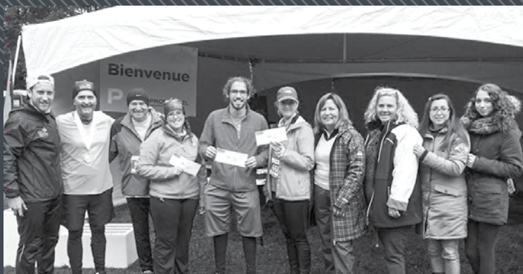
Remise des prix de présence lors du Demi-marathon des couleurs Promutuel de Bécancour