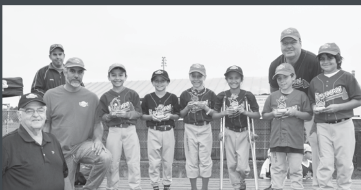
Distribution des trophées aux meilleurs joueurs de l'Association de baseball mineur de Belœil