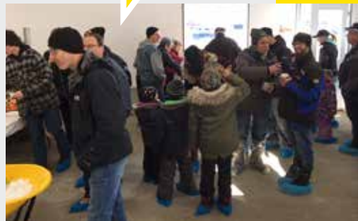
Photos prises en 2020, avant l'arrivée de la pandémie et l'application des mesures sanitaires