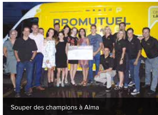
Souper des champions à Alma

Enfin, merci à vous, chers membres-assurés, d'être de plus en plus nombreux chaque année à nous faire confiance. En choisissant Promutuel Assurance, vous investissez dans l'économie locale et, par le fait même, dans les valeurs coopératives qui animent une entreprise mutualiste comme la nôtre. Merci de nous permettre, toujours et plus que jamais, d'être là.