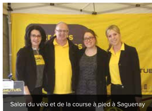
Salon du vélo et de la course à pied à Saguenay