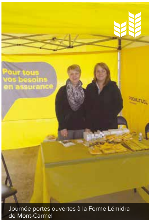
Journée portes ouvertes à la Ferme Lémidra de Mont-Carmel