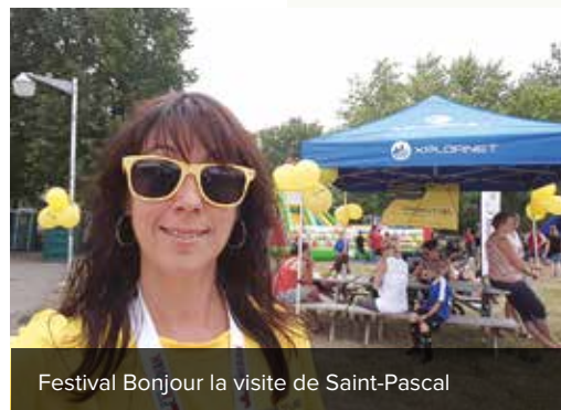
Festival Bonjour la visite de Saint-Pascal