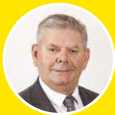
LE PRÉSIDENT, OMER BOUCHARD